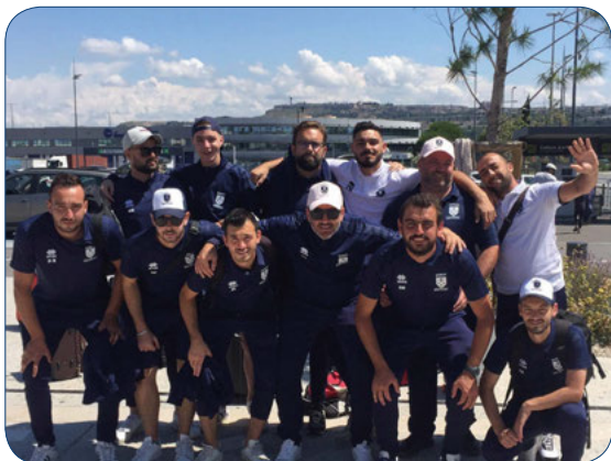
ALLEZ L'ENTENTE ! #TEAMGRAVESON